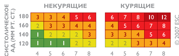
ОБЩИЙ ХОЛЕСТЕРИН ШКАЛА ОТНОСИТЕЛЬНОГО РИСКА

Для людей моложе 40 лет рекомендуется пользоваться Шкалой относительного риска . Шкала используется безотносительно пола и возраста человека и учитывает три фактора: систолическое (верхнее) артериальное давление, уровень общего холестерина и факт курения . Технология ее использования аналогична таковой для основной Шкалы SCORE.